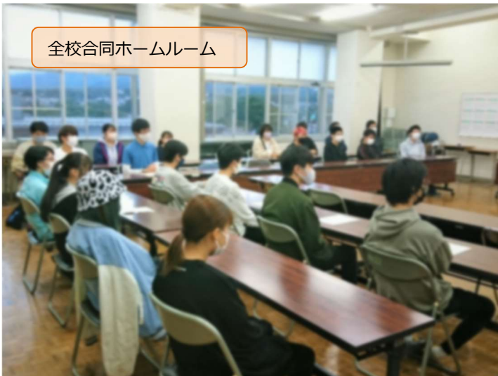
全校合同ホームルーム