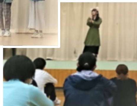
全校『ひもつなぎ』、『借り物競争』、『イントロクイズ』の様子