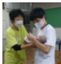
妊婦ジャケット体験

● 今日改めて、“自分が生まれてきたことは奇跡なんだ”と感じました。そして、妊婦体験をしてみて、妊婦さんの大変さが少しは分かったと思います。赤ちゃんは生まれてくる時、回って生まれてくることを初めて知ってとても驚きました。